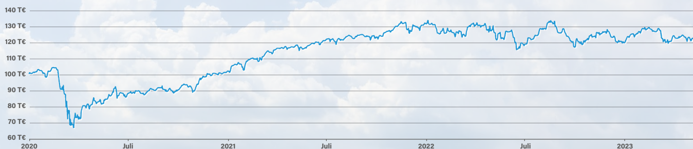
Abbildung 1: Aktien-Basisanlage im Zeitraum von 2020 bis heute

Für manche Menschen sah es in den vergangenen drei Jahren – und vielleicht immer noch – so aus, als würde die Welt zusammenbrechen. Wir alle haben in den letzten Jahren viel erlebt: Eine Pandemie, rasant steigende Inflation, einen Krieg in Europa und erhebliche Schwankungen an den Aktien-, Anleihen- sowie Strom- und Gaspreismärkten. Eine gewisse Nervosität ist in Anbetracht von so viel Unsicherheit durchaus verständlich.